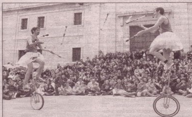
Los Estrambóticos finalizaron sobre monociclos y con fuego bajo la lluvia.

Algunos paraguas, capuchas y ropa que en los años precedentes acompañaron algunas de las funciones. Pero los aficionados al teatro de calle volvieron a respaldar el buen humor que reparten cualquier esquina artistas como las dos integrantes de la Compañía du Pingouin Quotidien, con sus acrobacias sobre una moto destalada. O los equilibrios sobre el hombro del ruso Dimitri Korneev. A juzgar por las colas, también merece la pena esperar para entrar en la carpa Luna Park de los holandeses De Stijle, Want.