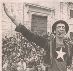
Los Estrambóticos. /H. SASTRE