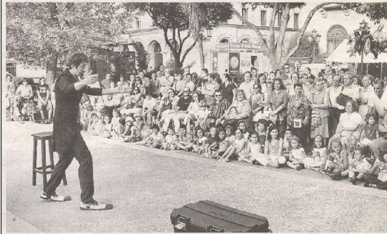
Los Estrambóticos hicieron las delicias de niños y mayores en la plaza de los Bandos.