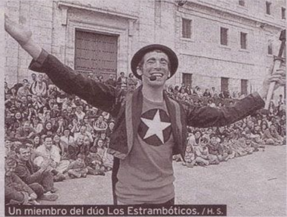
Un miembro del dúo Los Estrambóticos.

Su 'Kataplum' es la suma de los espectáculos callejeros. Del circo, al teatro, pasando por la música, el 'clown' y mucho humor para encontrar entre el público alguien de/con quien reírse y arrancar una sonrisa a los demás. Absurdo y complicidad apto para todos los públicos e incluso, animales domésticos.